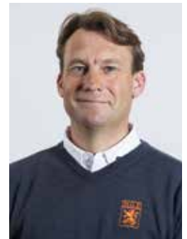
📍 Hayo Bensdorp